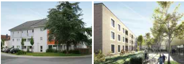
Godesberger Straße 33

Über 1.000 Wohnungen wurden in den letzten Jahren nachträglich mit Aufzügen ausgestattet und seniorenfreundlich umgebaut. Auch unsere Mehrgenerationen-Wohnprojekte bieten attraktiven Wohnraum für ältere Menschen, u.a. in der Godesberger Str. 33 oder neu in der Moritz-von-Schwind-Straße 11