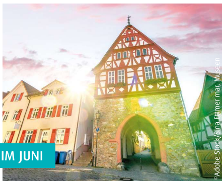
mar, Museum

2 Std. Führung um 14 Uhr Preis pro Person: 7,- EUR (Eigenanreise)